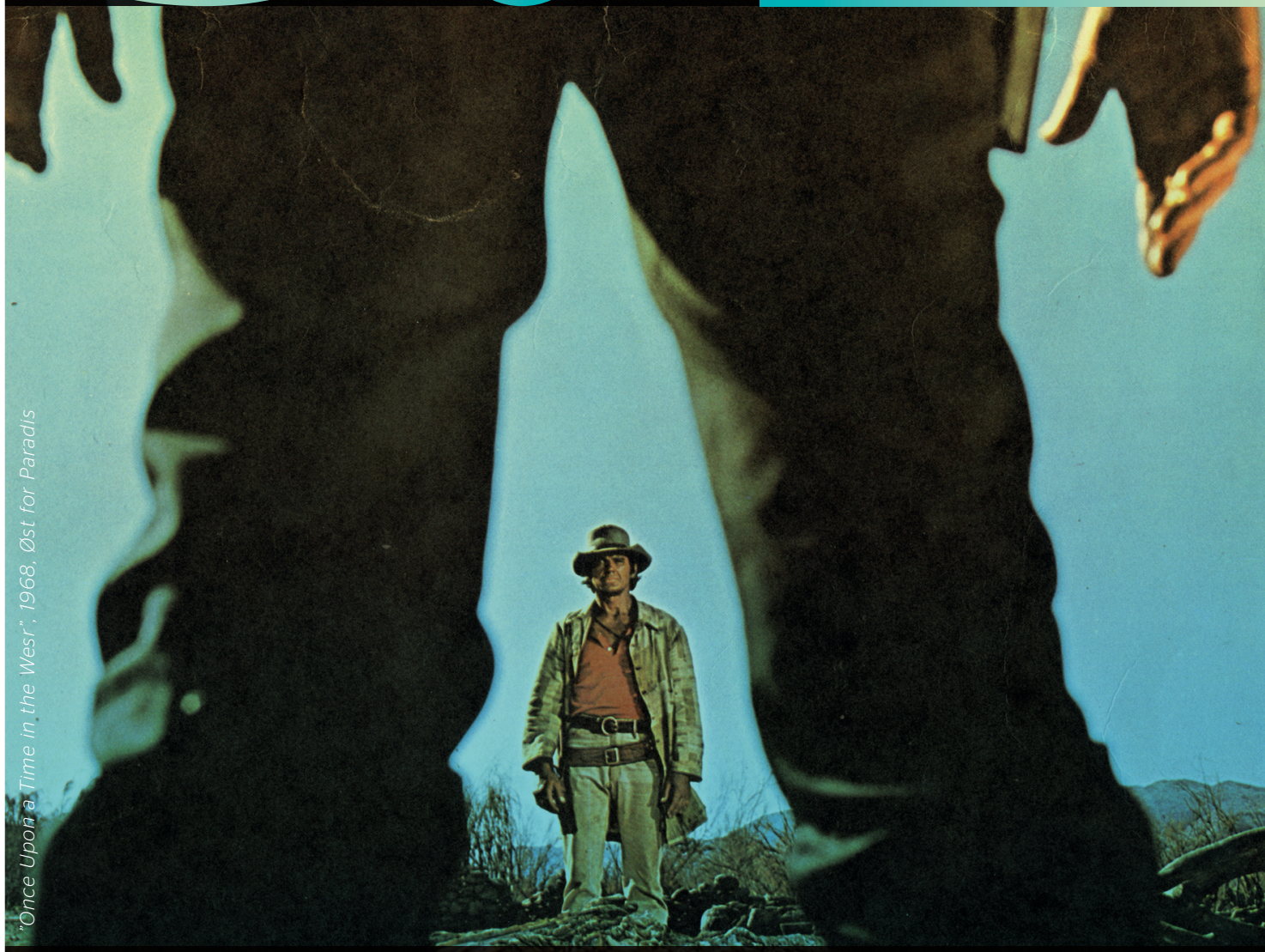
"Once Upon a Time in the West", 1968, Øst for Paradis